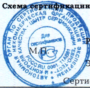
Схема сертификации №3.